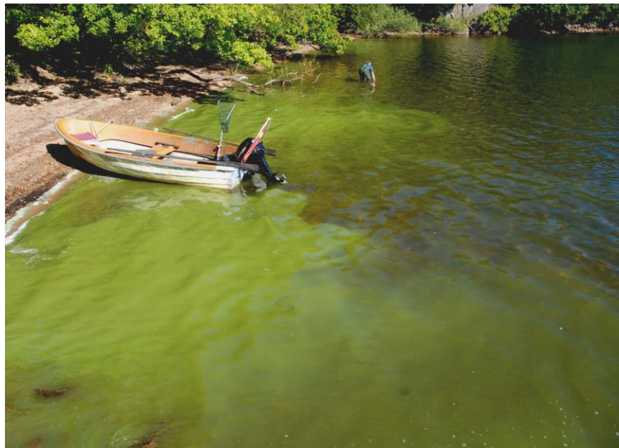
12 september 2016 – badstranden, Pumpviken