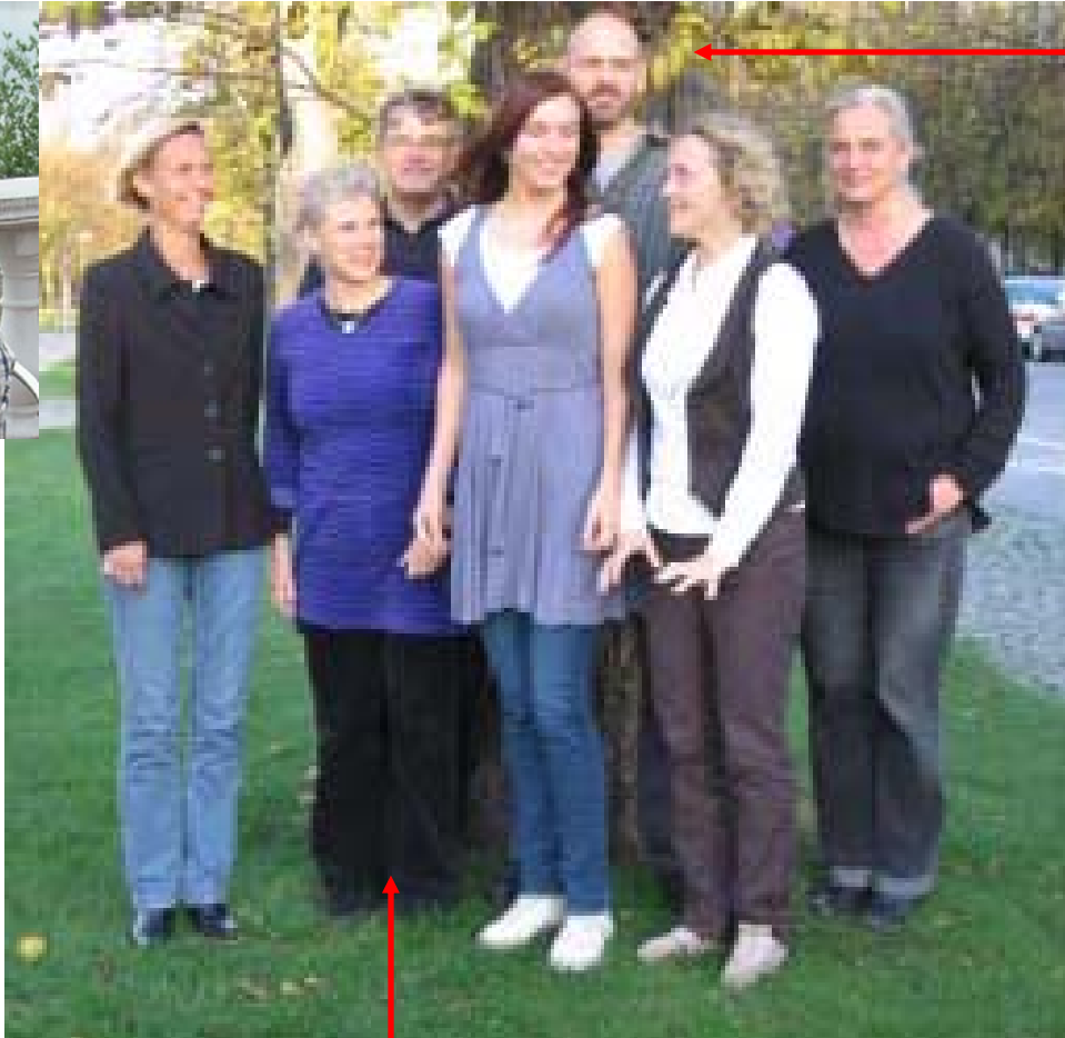
Fredrik A Kustvatten miljögifter