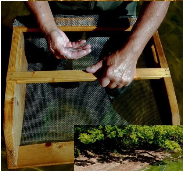
Nils-Arne har fångat ett nissöga med sållet