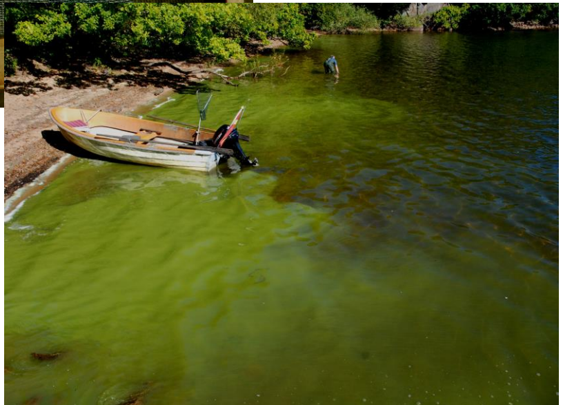
Giftiga blågröna alger har drivit in i Pumpviken