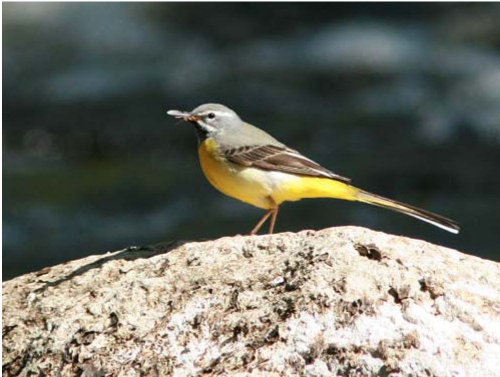
Forsärla med föda till ungarna

Som namnet tyder på trivs denna långstjärtade ärla vid forsande och strömmande vatten. Forsärlan häckar med flera par såväl i Holjeån som i Skräbeån. Fåglar ses även vid själva sjön men häckar inte här. Arten är härdig och övervintrar regelbundet i åarna.