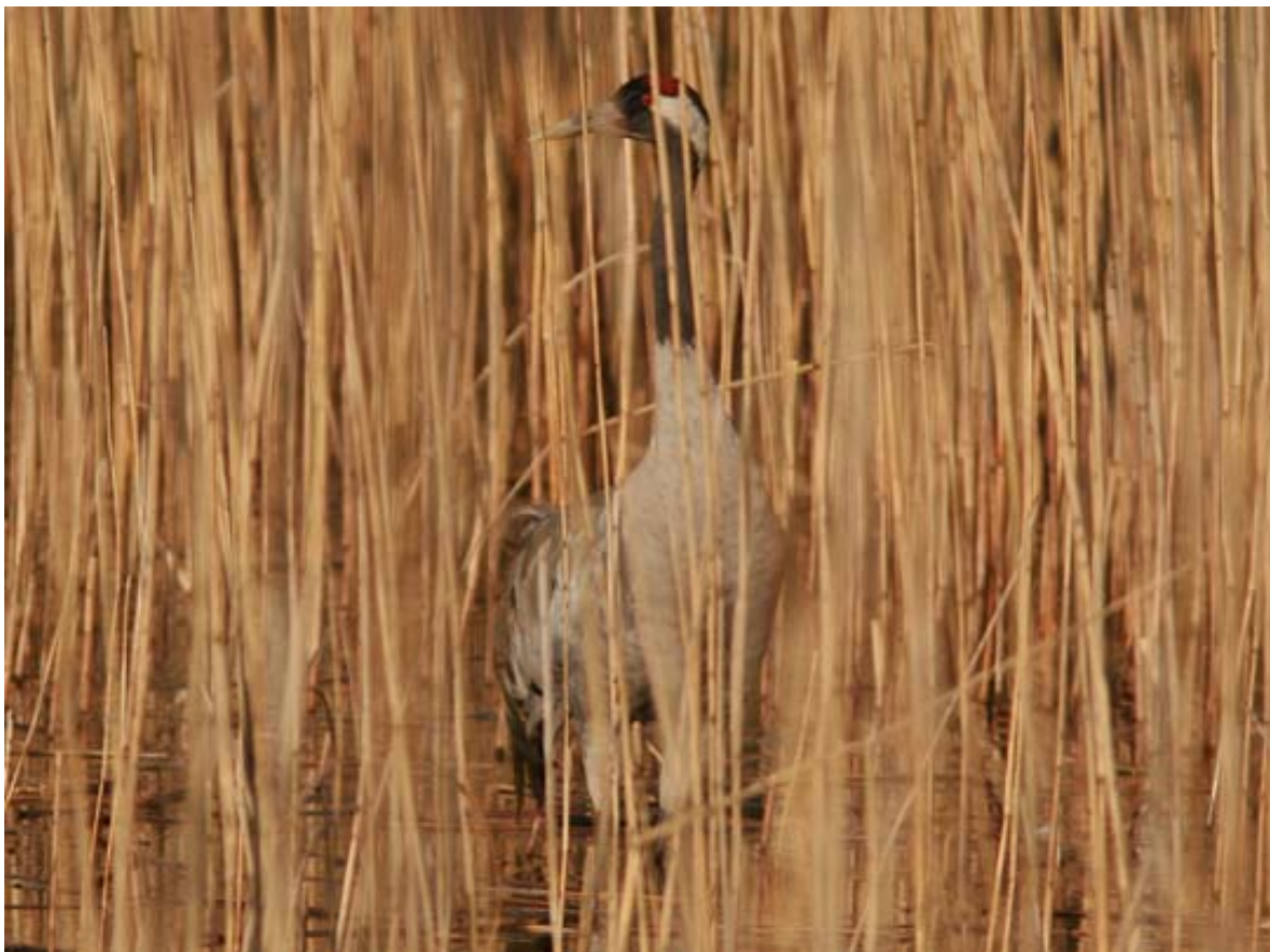
Trana i vassen

Tranans ökning och intagande av nya häckningsplatser i Skåne har varit påtaglig under senare år. Även om fågeln inte direkt är beroende av Ivösjöns stränder bör i all fall nämnas att under 2008 så häckade ett par på Enön. Vi vädjar om att avstå störningar i detta område under häckningstid.