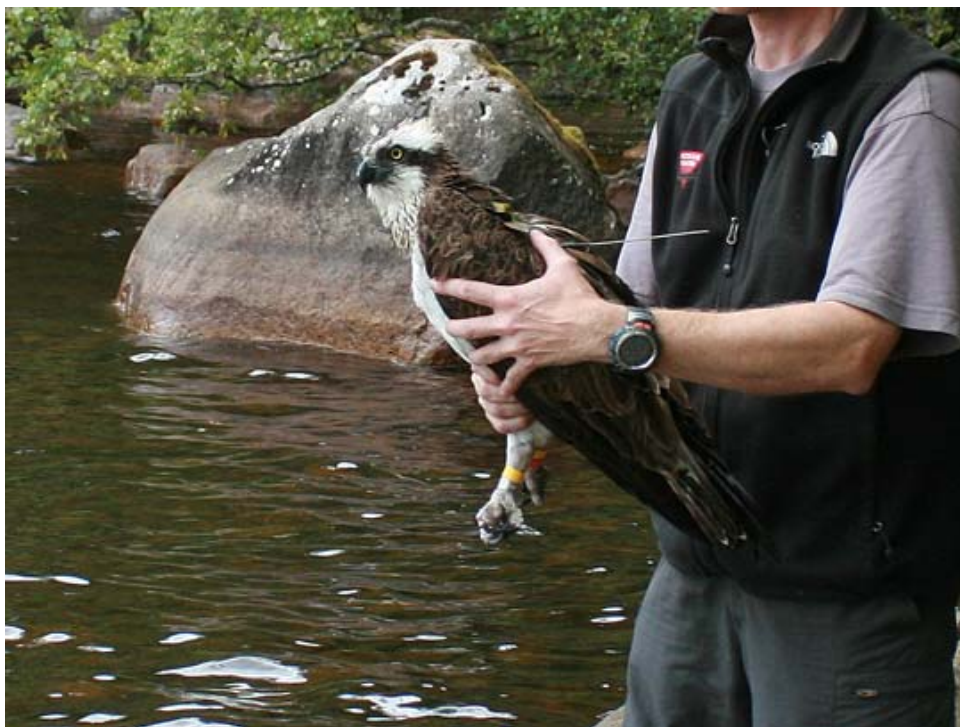
Fiskgjusehonan förses med satellitsändare den 15/7 2008

Det är med viss oro man ser utvecklingen för de häckande fiskgjusarna under 2008 i Ivösjön. Vissa tidigare revir står tomma och i något fall har enbart ena fågeln i paret återkommit eller så har häckningen misslyckats. Under de senaste 10 åren har visserligen beståndet varierat. 1998 häckade 8 till 9 par medan det under 2001 endast var 5 par som gick fram med ungar för att 2007 åter vara uppe i 7 häckande par. Flera faktorer oroar dock, fiskgjusar skjuts under flyttning eller övervintring, vattenresurserna i övervintringsområdena minskar eller förgiftas. På hemmaplan störs ibland boplatserna av obetänksamma eller slarviga människor i samband med olika friluftaktiviteter. Det finns alltså anledning att vi alla söker ta så stor hänsyn som möjligt vid fiskgjusehäckningarna.