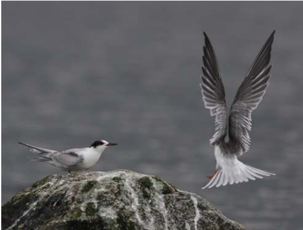
Fisktärneungen tigger mat

Årlig häckning av denna tärna sker sen mer än 10 år på tippområdet närmast sjön på Iföverkens område. Antalet par har varierat mellan två och fyra par. Därutöver häckar den regelbundet på någon sten eller skär i sjöns nordöstra delar.