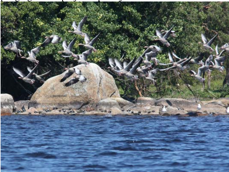
Grågässen lyfter, lägg märke till de rastande tofsviporna i bakgrunden

Från att ha varit en art som först på 1970-talet återkom till området som häckfågel så har grågäsen snarast utvecklats till att uppfattas vara en problemfågel för jordbruket. Arten häckar runt hela Ivösjön där den kan finna boplatser i vassar eller i buskmarker. Även längs Holjeåns nedre delar förekommer arten som häckfågel. Sedan 2007 ingår viken utanför Holjeåns mynning i ett undersökningsprojekt med flygfotografering som naturfotografen Patrik Olofsson genomför inom ramen för förvaltningsplanen för grågås under ledning av länsstyrelsen. Boräkningen här från dessa flygfoton gav då 2007 34 bon och 2008 32 bon. Till skillnad från Hammarsjön och Araslövssjön där projektet pågått sen 2004 kan man på två års undersökningar inte se någon tendens. I Kristianstads Vattenrike är tendensen minskat antal par grågäss sen projektet påbörjades år 2004.