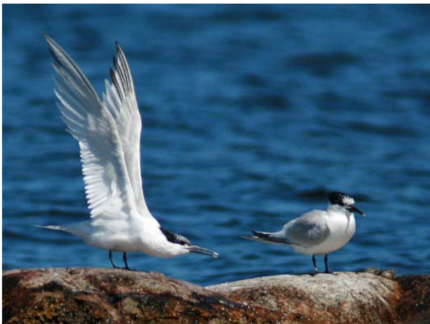
Rastande kentska tärnor

Denna havshäckande tärna ses under flyttning och födosök i varierande antal över sjön. Närmaste häckningsplats är belägen vid Tosteberga bodar.